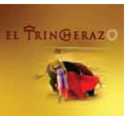
El Trincherazo Lunes 9, 20,15 h.

MARTES 10 13,00 Renada 13,20 Twipsy 13,50 La cocina de Mikel Bermejo 14,15 Dkda, sueños de juventud 14,30 Mujer de madera 15,15 Matrícula 16,00 Atei 20,00 Boletín informativo 20,15 Renada 20,35 Historias espeluznantes 21,00 La cocina de Mikel Bermejo 21,25 Dkda, sueños de juventud 21,55 Matrícula 22,30 Boletín informativo 22,40 De compras por Sanse 22,55 Teknópolis 23,25 Hª de sexo de gente común