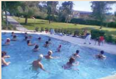
La natación es el deporte que más practican los ciudadanos. En segundo lugar está el fútbol.