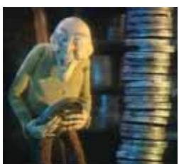
Historias espeluznantes. Lunes a viernes, 20,35 h.

JUEVES 12 13,00 Renada 13,20 Historias espeluznantes 13,50 La cocina de Mikel Bermejo 14,15 Dkda, sueños de juventud 14,30 Mujer de madera 15,15 Matrícula 16,00 Atei 19,00 Pleno Municipal Ordinario 20,00 Boletín informativo 20,15 Renada 20,40 Historias espeluznantes 21,00 La cocina de Mikel Bermejo 21,25 Dkda, sueños de juventud 21,50 Matrícula 22,25 Boletín informativo 22,35 De compras por Sanse 22,50 La mirada mágica 23,15 Cine: Mentira desnuda