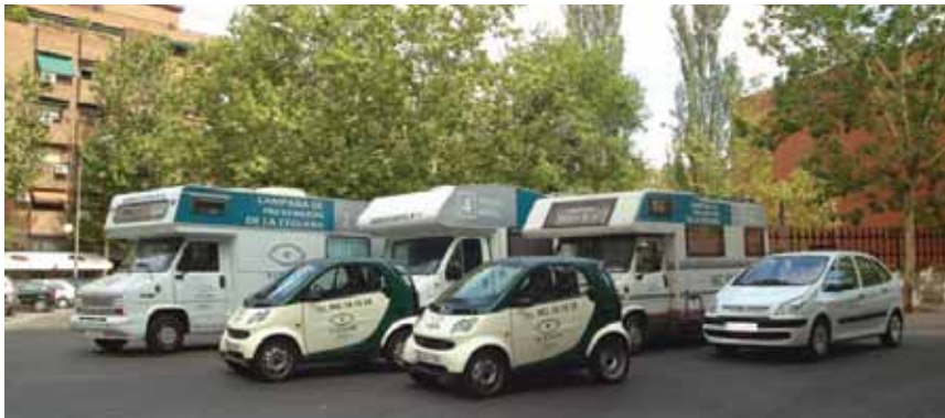
La unidad móvil dispone de diferentes instrumentos de última generación para hacer un exhaustivo examen de las diferentes estructuras del ojo y elaborar un diagnóstico.

OBJETIVO: PREVENIR. El fin de la Corporación mediante esta campaña es