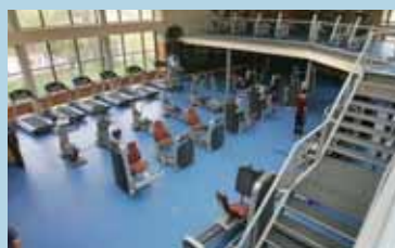
Vista del Dehesa Boyal que tendrá más puestos para afrontar la demanda.

E l Ayuntamiento ha convocado el concurso para la dotación de nuevas máquinas de entrenamiento cardiovascular en el Polideportivo Dehesa Boyal y en el Centro Sociocultural Claudio Rodríguez. Este concurso está en proceso de adjudicación y en breve la empresa que resulte ganadora tendrá que equipar estas instalaciones. Con esta inversión se atiende una demanda importante de los usuarios del Claudio Rodríguez y se dotan de más puestos en la Sala Dehesa Boyal para atender el incremento de Superabonados que se ha producido desde principios de año.