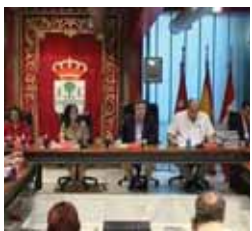
Pleno Municipal Jueves, 19,00 h.

VIERNES 13 13,00 Renada 13,20 Historias espeluznantes 13,50 La cocina de Mikel Bermejo 14,15 Dkda, sueños de juventud 14,30 Mujer de madera 15,15 Matrícula 16,00 Atei 20,00 Boletín informativo 20,15 Renada 20,40 Historias espeluznantes 21,00 La cocina de Mikel Bermejo 21,25 Dkda, sueños de juventud 21,50 Matrícula 22,30 Boletín informativo 22,40 De compras por Sanse 22,55 Villarriba y Villabajo 23,45 Zoombados