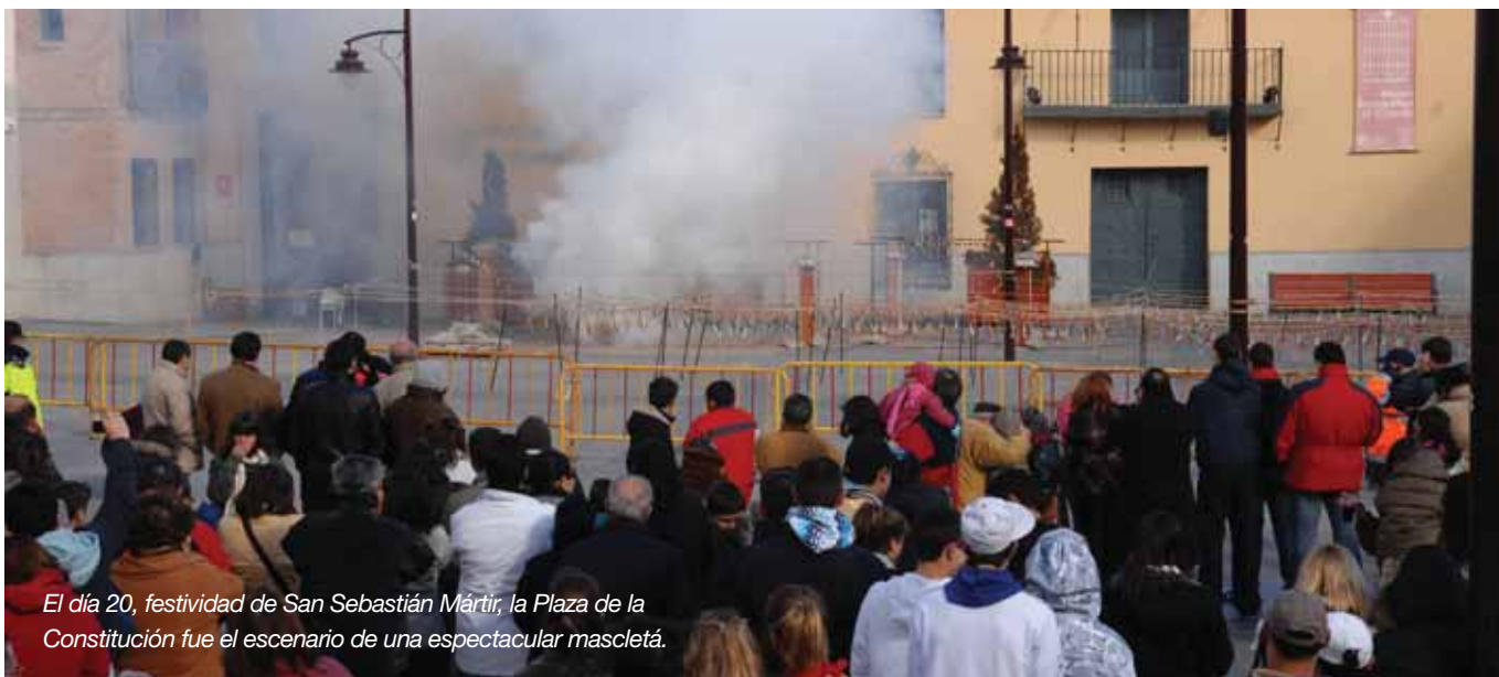
El día 20, festividad de San Sebastián Mártir, la Plaza de la Constitución fue el escenario de una espectacular mascaletá.