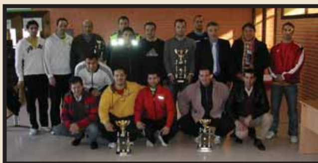
Sobre estas líneas, los responsables de los equipos que han logrado trofeo en esta competición que se afianza en su segundo año.

C on motivo de la festividad de San Sebastián Mártir, se ha celebrado durante los días 15 y 16 de enero el II Torneo de Fútbol-7 de Fuerzas y Cuerpos de Seguridad en el Polideportivo Dehesa Boyal, en el que han participado Policías Locales de distintos municipios de la Comunidad de Madrid, así como el Cuerpo Nacional de Policía y Guardia Civil. La clasificación