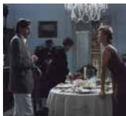
Villarriba y Villabajo Viernes, 22,55 h.

LUNES 2 13,00 Renada 13,20 Twipsy 13,50 La cocina de Mikel Bermejo 14,15 Dkda, sueños de juventud 14,30 Mujer de madera 15,15 Matrícula 16,00 Atei 20,00 Boletín informativo 20,15 Renada 20,40 Twipsy 21,00 La cocina de Mikel Bermejo 21,30 Dkda, sueños de juventud 21,55 Matrícula 22,30 Boletín informativo 22,40 De compras por Sanse 22,55 Viajes 23,50 Policias en acción