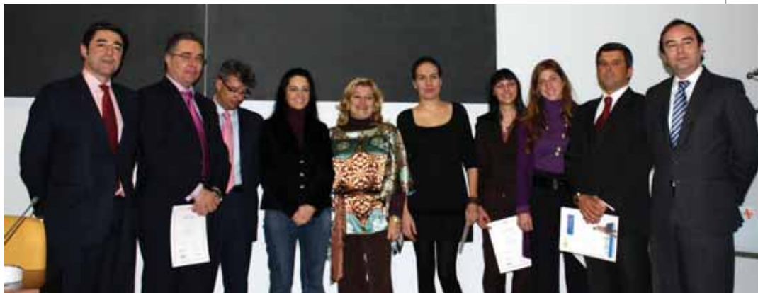
Los presidentes de ACENOMA y ASEMPRO junto a los representantes de la Fundación Másfamilia, la concejala de Desarrollo Local, la de Igualdad, y los responsables de las empresas ganadoras.

Asfa 21 y Construcciones Palada, que pertenecen a la asociación empresarial Asempro, se unen a las 4 empresas ya certificadas con anterioridad, y consiguen que San Sebastián de los Reyes, que lleva a cabo otros proyectos en esta materia, se posicione como uno de los Ayuntamientos en España líderes en materia de conciliación de la vida laboral y familiar.