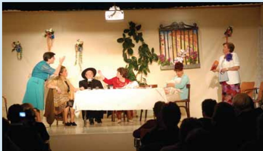
Los alumnos y alumnas del taller presentan el trabajo realizado con estas obras que tienen como objetivo divertir y hacer una reflexión sobre la convivencia en pareja.