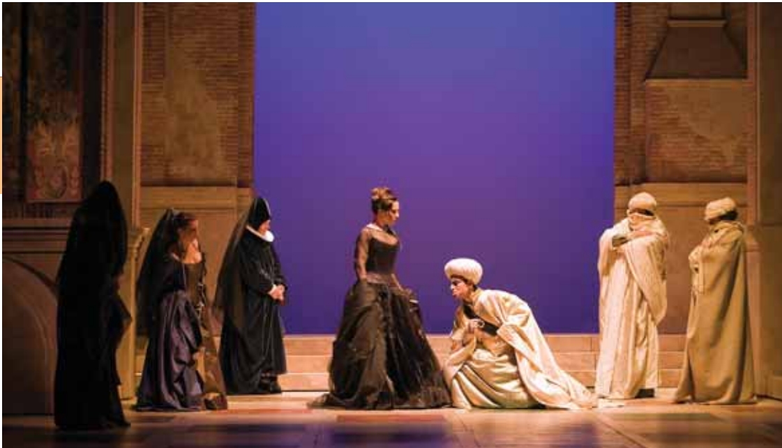
'El mercader de Venecia', de Darek Teatro y dirigido por Fernando Conde.

siones por los especialistas. "Es el reflejo del universo propio de