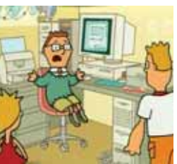
Twipsy Lunes a viernes, 20,35 h.

MIÉRCOLES 11 13,00 Renada 13,20 Historias espeluznantes 13,50 La cocina de Mikel Bermejo 14,15 Dkda, sueños de juventud 14,30 Mujer de madera 15,15 Matrícula 16,00 Atei 20,00 Boletín informativo 20,15 Renada 20,35 Historias espeluznantes 21,00 La cocina de Mikel Bermejo 21,25 Dkda, sueños de juventud 21,50 Matrícula 22,25 Boletín informativo 22,35 De compras por Sanse 22,50 Deportes de Aventuras 23,15 Plan América