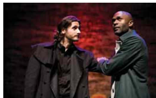
El actor y director Juan Diego Botto subraya en este 'Hamlet' el carácter fuerte del protagonista.

Ha montado doce obras de Lope, Tirso y de Calderón en el Gate Theatre y con la Royal Shakespeare Company, y el año pasado se responsabilizó del montaje de Fuenteovejuna, en el Stratford Festival de Ontario, Canadá. Además, es un habitual de los teatros del West End londinense y de Broadway, donde ha dirigido, entre otros, a Clive Owen y a Madonna.