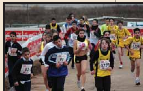
Las pruebas de cross combinan la convocatoria popular con la competición profesional. El evento se completa con carpas donde la organización de las pruebas entretiene al público. En la pasada edición se inauguró un circuito de la Dehesa Boyal con dos recorridos donde entrenan atletas madrileños.

superior del nuevo circuito de cross permanente Dehesa Boyal. En esta zona se habilitan las distintas áreas del evento, con carpas expo para los visitantes, zona de secretaría y organización, y zona de invitados.