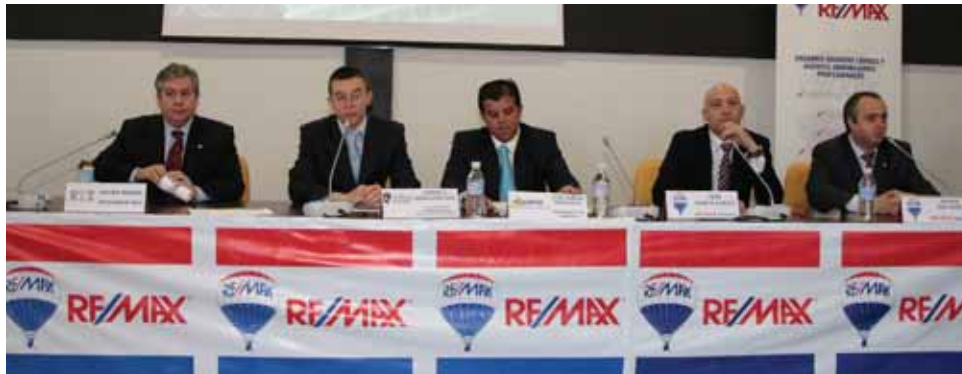
Los ponentes de la I Jornada sobre el futuro del sector inmobiliario, en la que se pusieron sobre el tapete las respuestas en relación a la situación de incertidumbre actual.

IMPULSADA POR EL AYUNTAMIENTO, ASEMPRO Y REMAX ESPAÑA