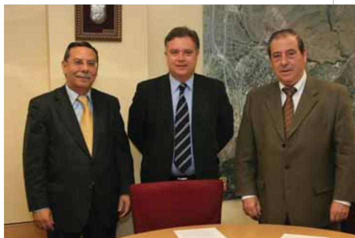
El alcalde de San Sebastián de los Reyes junto a los regidores de Colmenar Viejo y Tres Cantos.

La carta que los alcaldes remiten a Manuel Azuaga, director general de AENA, así lo expresa y lo justifica en el hecho del tránsito por esta ruta del 40 por ciento de los despegues. Una situación que, a juicio de los tres ediles, justifica plenamente que "ha llegado el momento de constituir