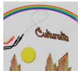
Culturalia Lunes 22,35 h.