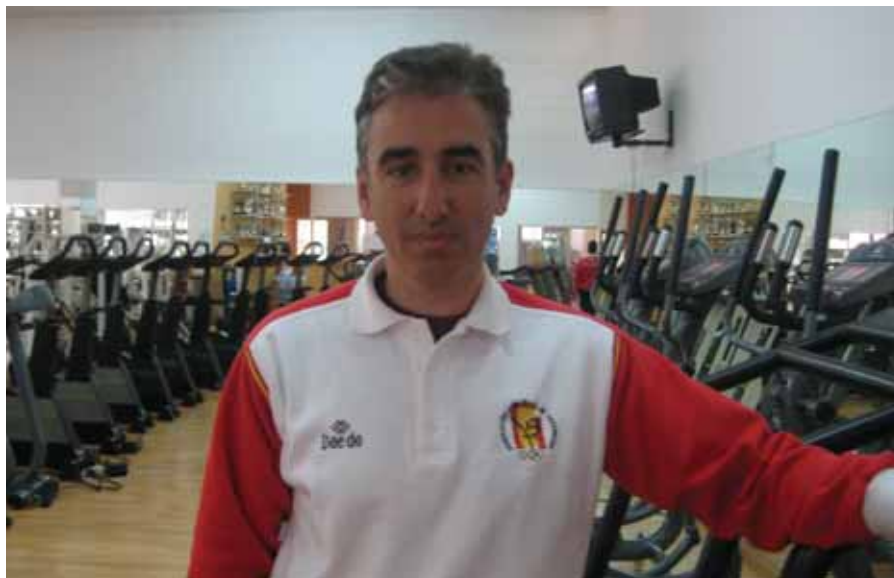
JESÚS TORTOSA, SELECCIONADOR NACIONAL DE TAEKWONDO