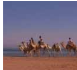
Diario de Egipto Miércoles 16, 23 h.

13,00 Los juguetes olvidados 13,30 Santo Buguito 14,00 La cocina de Mikel Bermejo 14,15 Por tu amor 15,00 Matrícula 16,00 Atei 20,00 Boletín informativo 20,10 Agenda municipal 20,15 Los juguetes olvidados 20,40 Santo Buguito 21,05 La cocina de Mikel Bermejo 21,30 Corazones al límite 21,55 Matrícula 22,25 Boletín Informativo 22,35 Skippy 23,00 Hostal Royal Manzanares