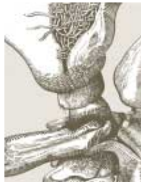
▲ Exposición de Ángel Bellido