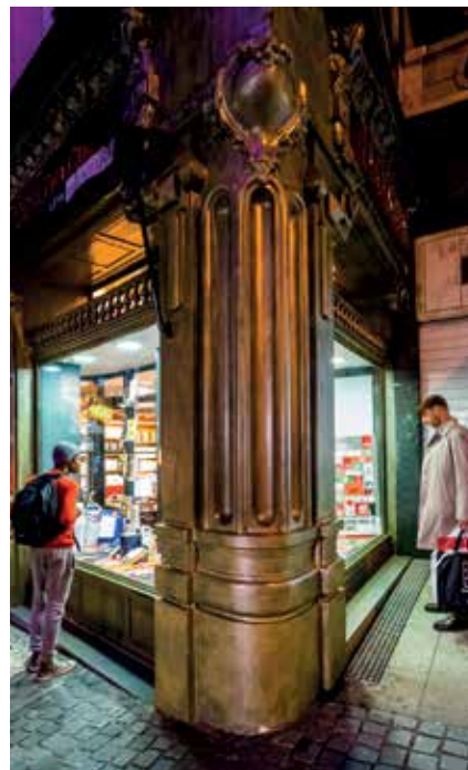
▲ "Una esquina, dos miradas", primer premio.

TAM , Av. de Baunatal, 18 Sábado: 9 abril | 20:00h Domingo: 10 abril | 19:00h Precio único: 20 €/ Duración aprox: 130 min. Edad recomendada: a partir de 12 años