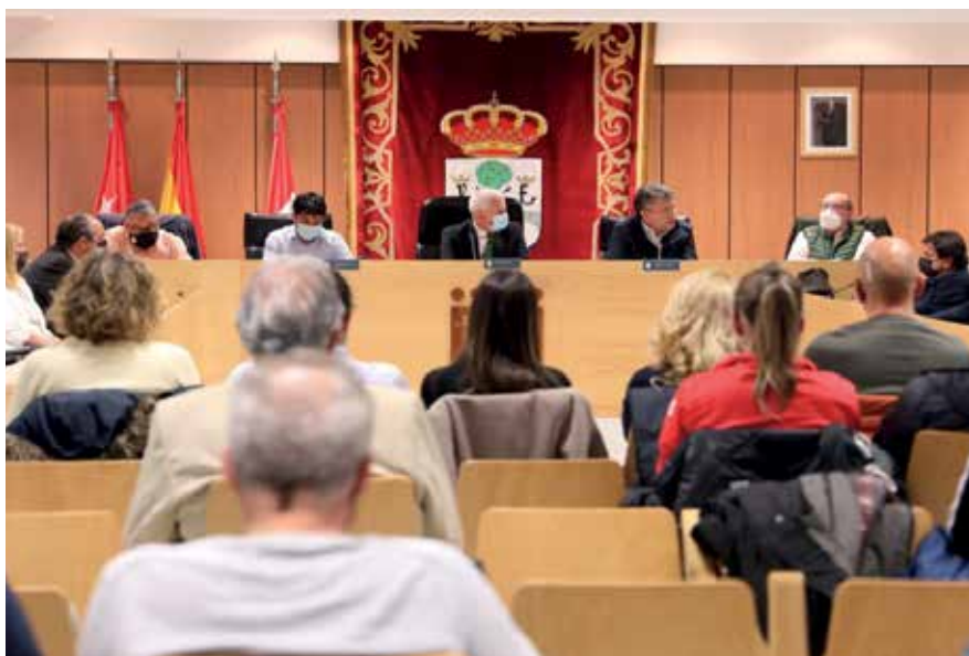
▲ A la presentación de sensedeporte.es asistieron los vecinos interesados o vinculados al deporte de Sanse.