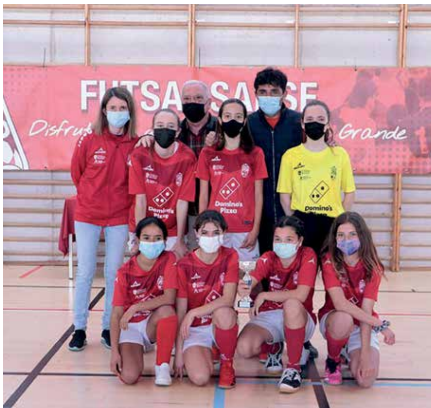
▲ Jugadoras del Futsal Sanse, en un torneo donde ganaron todas.

Dado el éxito del torneo, todo el mundo tiene claro que este no será el último que se celebre, y por eso, el club hace un llamamiento a todas las deportistas de Sanse que quiera disfrutar del fútbol sala, a que se unan a esta gran familia, esperando a las futuras futbolistas con los brazos abiertos. ■