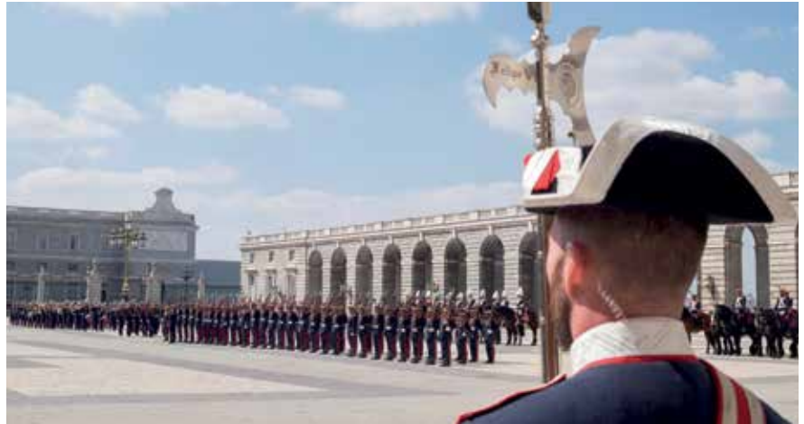
▲ Relevo Solemne de la Guardia Real, el miércoles día 6.

Salida a Madrid. Relevo Solemne de la Guardia Real. Salida: 9:30 h. del Centro Municipal de Mayores. Regreso: 14:45 h. Para los admitidos en esta salida que tuvo que anularse en febrero.