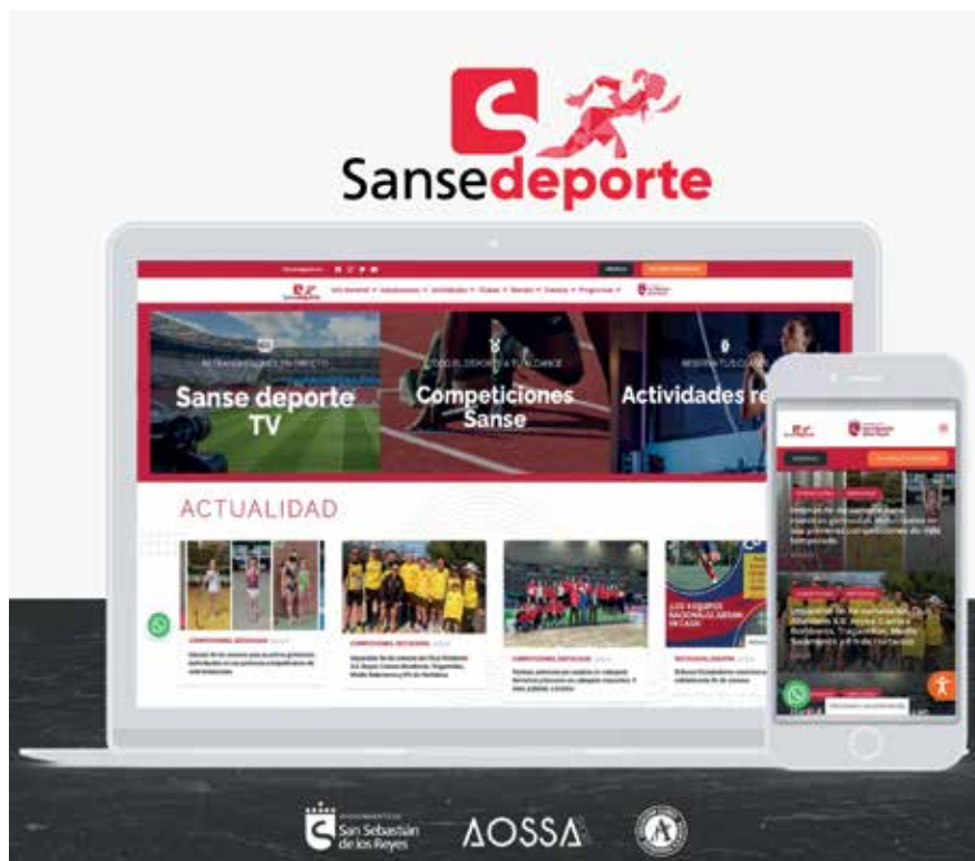
▲ Esta web municipal es pionera en nuestro país, y aporta todo lo necesario para ofrecer una información completa y actualizada.