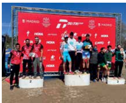
▲ Los duatletas de Sanse, en lo más alto del pódium.

Los posteriores 40 kilómetros de bicicleta se controlaron por el equipo de Sanse,