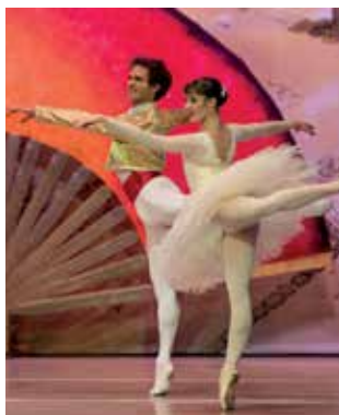
▲ 'Don Quijote', el sábado día 23 en el TAM.