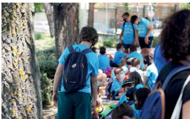
▲ Los campus ofrecen actividades de todo tipo para no parar ni un segundo de aburrimiento.

Un año más, el Ayuntamiento junto con la colaboración de la Asociación de Clubes Deportivos de San Sebastián de los Reyes y los clubes deportivos del municipio, organizarán los Campus de predeportivos de verano 2022. Un evento diseñado para los niños y niñas de entre 3 años a 16 años del municipio que quieran participar en múltiples actividades en el periodo estival a través de los clubes del municipio.