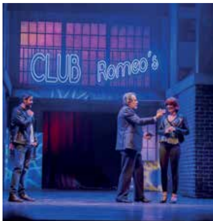
▲ Escena de esta obra basada en la popular película de los 90.

Celosos y sin trabajo, los hombres inventan una forma atrevida de hacer algo de dinero rápido. Al prepararse, se encuentran extremadamente expuestos tanto física como emocionalmente. A medida que vencen el miedo, la timidez y los prejuicios, los hombres descubren que son más fuertes como grupo, y la fuerza que encuentran el uno en el otro les da el valor para hacerlo.