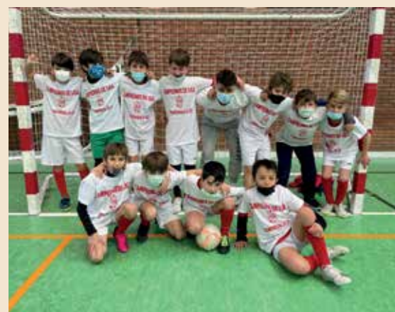
▲ Este arte marcial aún a elegancia y efectividad.

Y es que el éxito de la familia del Club Futsal Sanse radica en esto: competición unido a la educación y formación en los valores del deporte, porque son conocedores de que la competición no está reñida con el compañerismo y el "fair play". ■