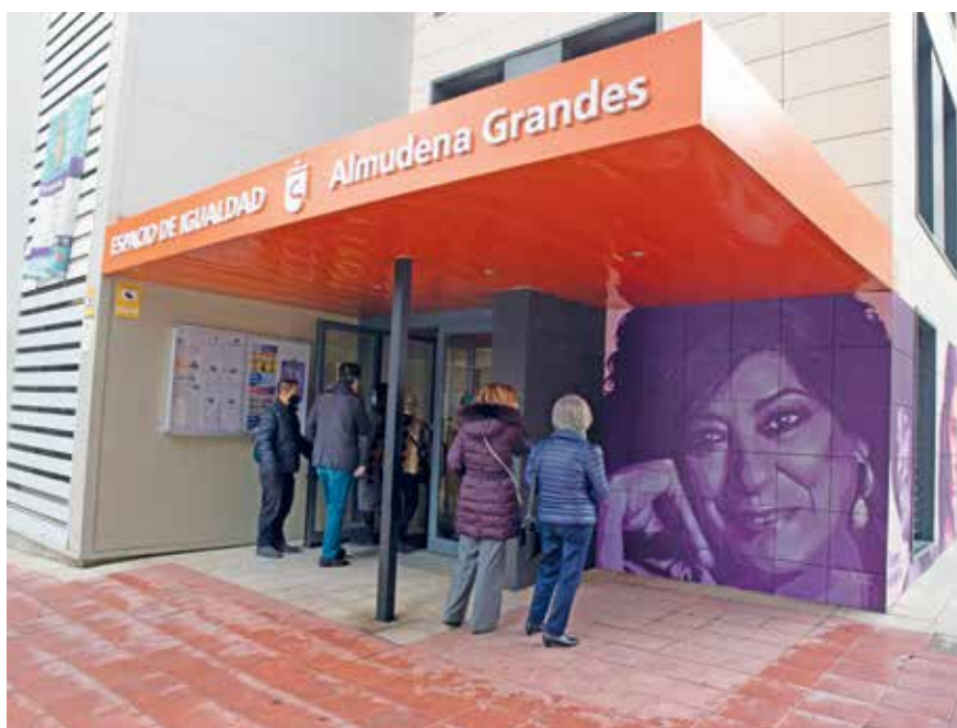
▲ Entrada del nuevo Espacio de Igualdad Almudena Grandes, en homenaje a la novelista fallecida hace unos años.

► Exposición ponle foco. Como resultado de la actividad celebrada en torno al 8 de marzo, Paseo Fotográfico Ponle Foco, el Espacio de Igualdad Almudena Grandes albergará la exposición fotográfica compuesta por las instantáneas que las participantes en el taller tomaron en las calles de San Sebastián de los Reyes y que, posteriormente, editaron. Se trata de una selección de