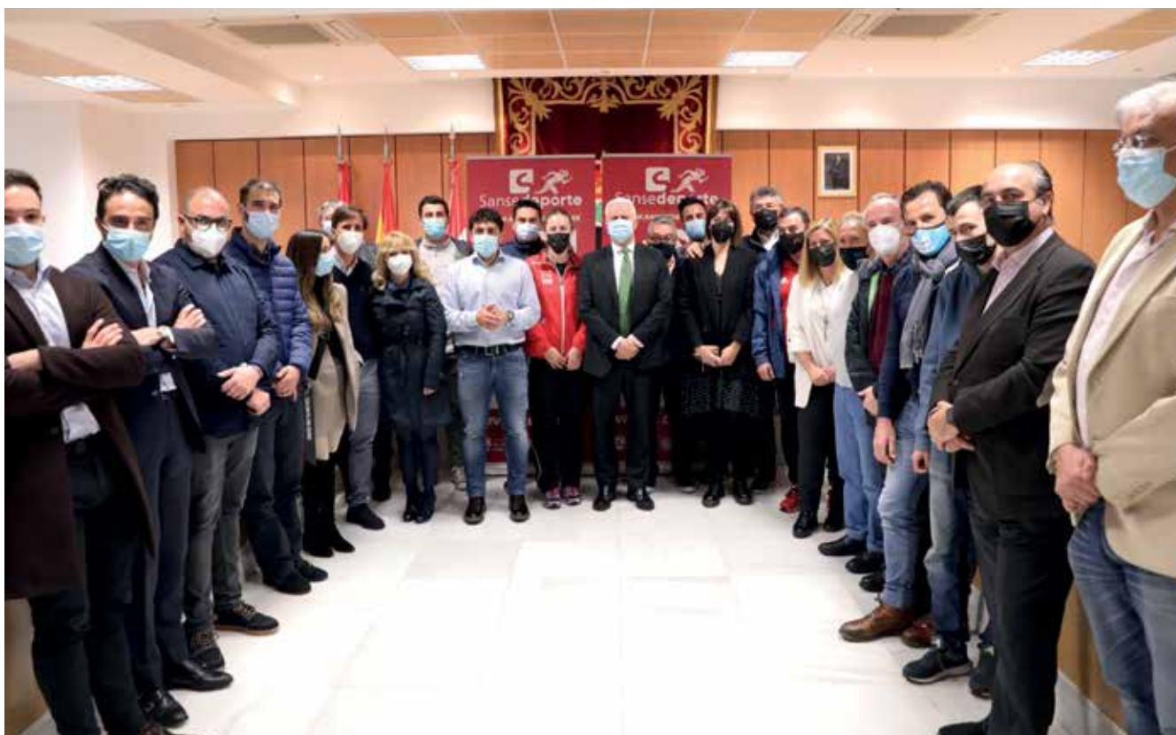
▲ Los representantes municipales y del deporte en nuestra ciudad, en el Ayuntamiento el día de la presentación oficial de la nueva web.

“Vive el deporte” es el lema de lanzamiento del nuevo impulso a la comunicación deportiva de la ciudad en la que participan los clubes deportivos, concesionarias y Concejalía de Deportes. El nuevo canal de comunicación de deportes es un proyecto pionero a nivel nacional en el que se reúnen todas las informaciones relativas a la práctica deportiva en el municipio.