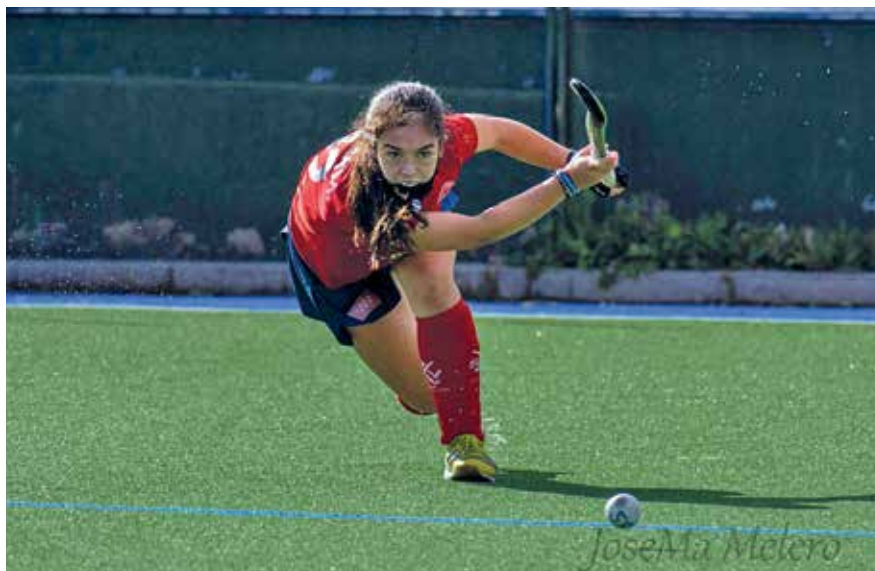
▲ La jugadora de Sanse, en plena acción de juego durante un partido reciente..

¡El campo nuevo ha sido una de las mejores noticias que he recibido en estos días! A nivel local es muy importante para que la escuela siga creciendo y mejorando, ya que se