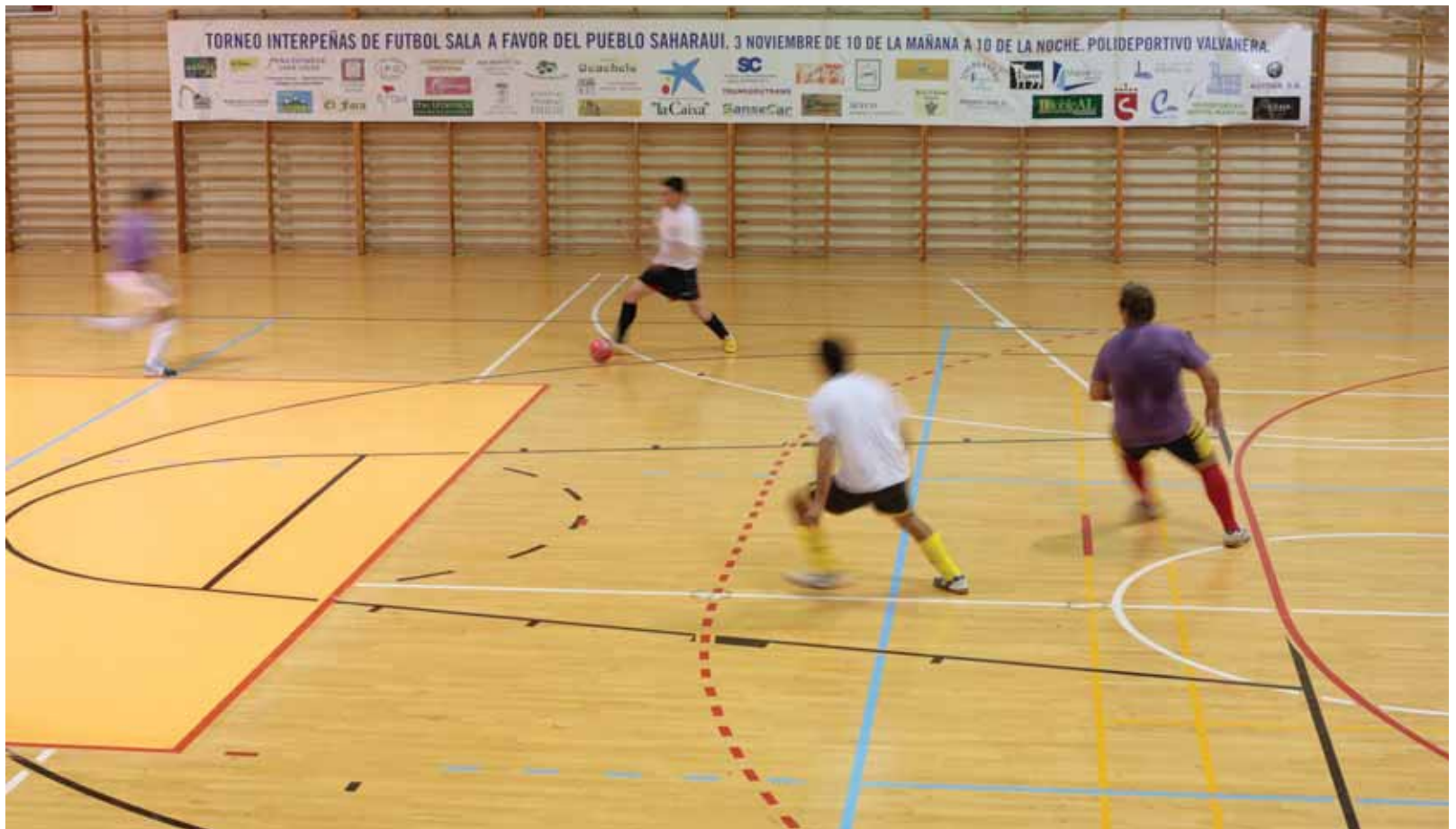
24 equipos de fútbol sala midieron sus fuerzas por una buen motivo: ayudar al pueblo saharauí.

I TORNEO INTERPEÑAS DE FÚTBOL SALA A FAVOR DEL PUEBLO SAHARAUI