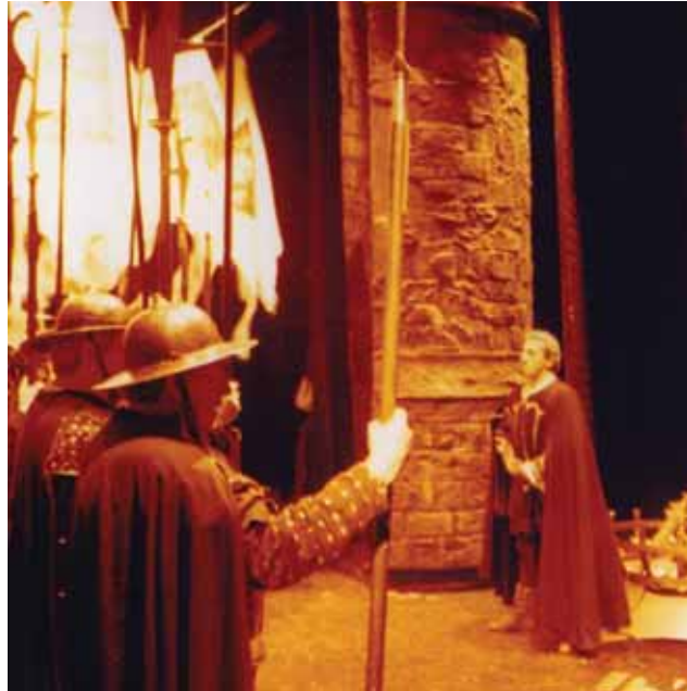
El sábado 24 se representará en el TAM la ópera de Verdi "Il Trovatore", una oportunidad magnífica para los aficionados.

Autor: Eduardo de Filippo Versión: Juan José Arceche Dirección: Ángel F. Montesinos Reparto: Concha Velasco, Héctor Colomé... Hora: 20:00 TAM Precio: 15 €