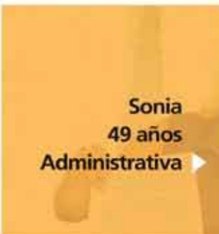
Sonia 49 años Administrativa ▶

Llámale personalmente por teléfono el próximo jueves 5 de julio de 12 a 14h.