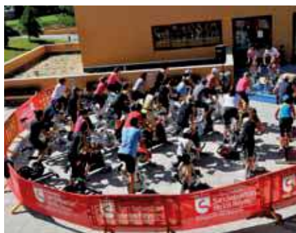
El spinning, disciplina habitualmente "indoor", sale al aire libre para todo aquel que quiera "castigarse" dando pedales en la bicicleta estática.

para la piscina exterior, y acogerá al colegio Base (La Moraleja) y la asociación La Tormenta para realizar distintas actividades deportivas. En definitiva, tu polideportivo se viste más de corto aún si cabe este verano para recibir con los brazos abiertos a todos aquellos que quieran practicar su deporte favorito. ●●●