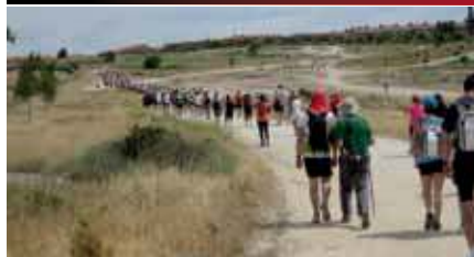
Este año la prueba ha contado con 1.500 participantes, todo un éxito.

Un total de 1501 participantes, entre las cuatro modalidades disponibles (100 km individual, 100 km bici, 100 km por relevos y caminata de 34 km), tomaron parte en la prueba que discurre por las Vías Pecuarias de la Comunidad de Madrid y que organiza la revista Corricolari es Correr.