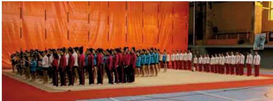
A las actividades que organiza el club de gimnasia rítmica se apuntan cientos de chicas apasionadas por un deporte en el que Sanse aporta una interesante cantera.

Como remate a esta atractiva oferta, la Concejalía de Deportes también recibe los programas de juventud Summersanse y el Campus de Inglés