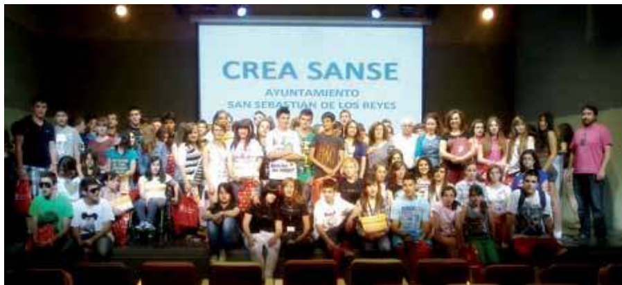
Los representantes de los jóvenes que formaron parte de este proyecto recibieron un diploma.

El pasado mes de enero se puso en marcha el proyecto 'Crea Sanse' con el objetivo de fomentar la participación de los jóvenes y crear una vía de comunicación directa entre ellos y el Ayuntamiento, a través de la Concejalía de Juventud. Este proyecto se ha desarrollado en los cinco Institutos de Educación Secundaria del municipio y para llevarlo a cabo ha sido fundamental la coordinación y la colaboración entre las partes implicadas.