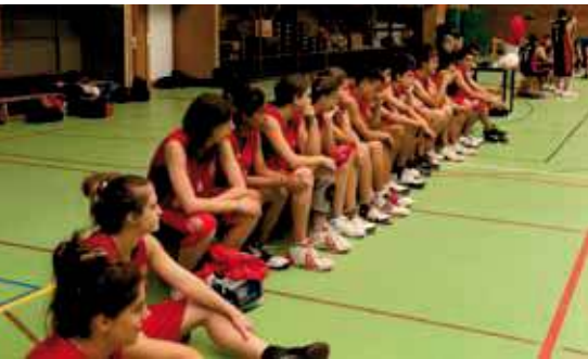
El campus de baloncesto que organiza el club Zona Press es uno de los más multitudinarios.

masiva participación de la presente convocatoria. Pero aquí no acaban las posibilidades. Otro plato fuerte son los cursos intensivos, que se prolongan hasta finales de julio en tres grandes grupos: actividades de raqueta (tenis y pádel); actividades físicas (pilates, yoga, tai chi); y actividades acuáticas, para todas las edades, por la mañana y tarde, con el añadido de la magnífica piscina exterior, con amplias zonas de césped y sombra, preparada para el disfrute de los vecinos.