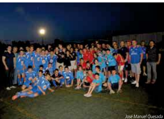
Los componentes al completo de los equipos que participaron en el Memorial.

El C.D. Carranza rindió homenaje el sábado 16 de junio a la madre de un jugador infantil que falleció a causa de un infarto hace dos meses en un viaje con el equipo para disputar un trofeo en Torre vieja. Durante el fin de semana del 16 de junio tuvo lugar este torneo conmemorativo quedando la clasificación como sigue.