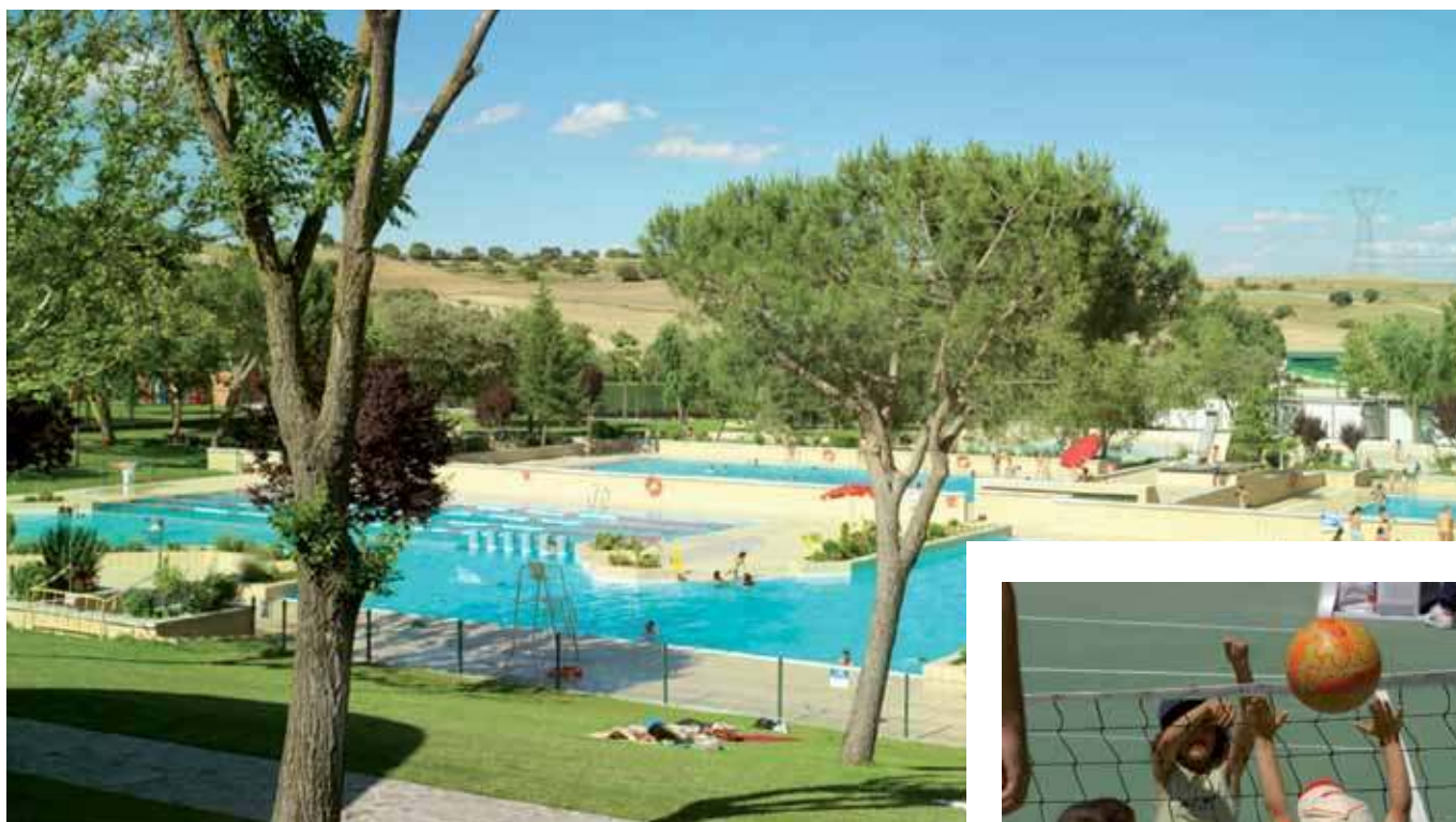
La piscina del Polideportivo Dehesa Boyal es una de las grandes atracciones del verano. Pero no la única.

La oferta municipal de actividades deportivas despliega un abanico para todos los gustos y edades: campus de baloncesto, judo, gimnasia rítmica, multideporte, taekwondo, ciclismo...; cursos intensivos de raqueta, acuáticos, físicos... Este verano el Dehesa Boyal te propone no pasar ni un segundo de aburrimiento.