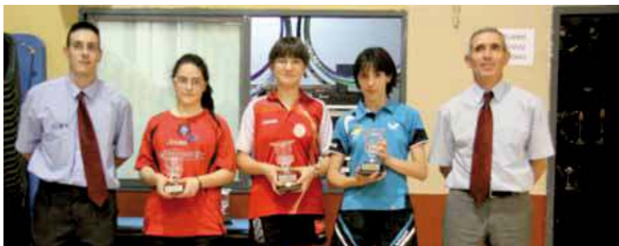
La joven jugadora sansera se impuso en la competición individual proclamándose campeona de Madrid.