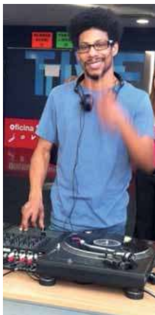
Conviértete en un DJ de categoría con el taller que te ofrecemos.

Del 16 al 30 de julio Lunes y miércoles, de 11.00 a 14.00 h. Precio: 8 euros