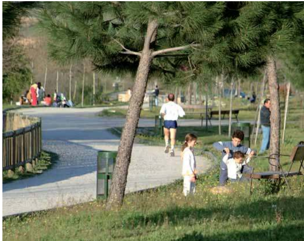
Los parques y las zonas verdes han sido una de las grandes prioridades durante estos cinco años.