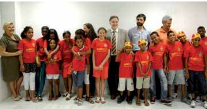
El Ayuntamiento regaló a cada niño la camiseta de la selección española.

La Asociación Amigos del Pueblo Saharaui de San Sebastián de los Reyes y Alcobendas organiza la 'VIII Gala de Magia con el Sahara', con el fin de recaudar fondos para el programa 'Vacaciones en Paz' que consiste en la acogida de niños saharauis durante dos meses.