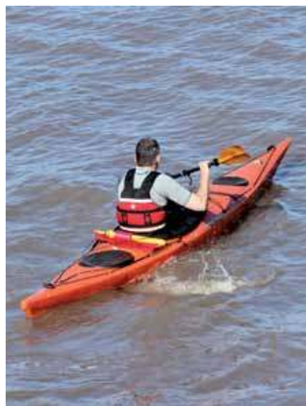
El piragüismo es una de las actividades más demandadas del Aula de Tiempo Libre.

San Ildefonso de la Granja. Precio: 19 euros. Fecha de inscripción: hasta el 24 de julio. La lista de admitidos se publica el 26 de julio. ●●●