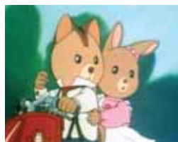
La aldea del Arce. Lunes a jueves, 20,15 h.

15,00 Noticias Norte 15,30 Cine: El factor Pilgrim 16,55 Frontera límite 17,50 Teknópolis 18,20 Ciudades para el siglo XXI 18,45 De Polo a Polo 19,15 Reparto a domicilio 20,00 Noticias Norte 20,30 Raquel busca su sitio 22,35 Mis enigmas favoritos 23,50 Zoombados