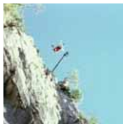
Frontera límite Miércoles, 22,40 h.