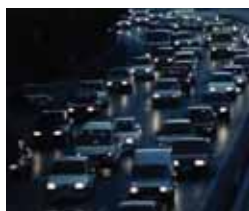
Adosados Jueves, 7, 20,15 h.