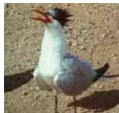
De Polo a Polo Jueves, 22,40 h.