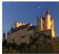
Ciudades para el siglo XXI Lunes, 22,45 h.