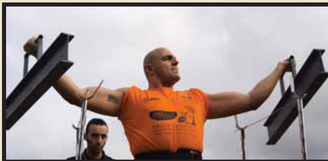
La Liga Nacional de Fuerza se creó en 2008 y en ella compiten los mejores atletas de fuerza españoles para ser el mejor en una serie de pruebas a cual más espectacular y difícil.

La LNF se creó en 2008, y es algo innovador en España en el campo del deporte-espectáculo. En España se han desarrollado hasta la fecha pruebas sueltas sin continuidad, y por ello no han llegado al gran