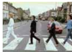
El factor Pilgrim Fin de semana, 15,30 h.

15,00 Noticias Norte 15,30 Cine: Primer y último amor 17,20 Frontera límite 18,15 Teknópolis 18,45 Ciudades para el siglo XXI 19,10 Reparto a domicilio 20,00 Noticias Norte 20,30 Raquel busca su sitio 22,40 Mis enigmas favoritos 00,05 Zoombados