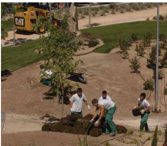
Este parque se ha diseñado con principios de sostenibilidad: vegetación autóctona y riego con agua reciclada. Los alumnos de la escuela taller han ejecutado un proyecto que les ha servido para formarse.